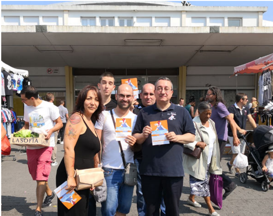
Les Patriotes sur le marché de Saint-Nazaire