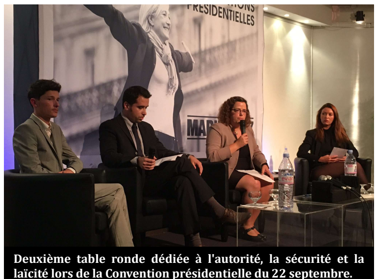
Deuxième table ronde dédiée à l'autorité, la sécurité et la laïcité lors de la Convention présidentielle du 22 septembre.

PROPOSITION 51 : Contrôler strictement les associations et particuliers se proposant d'intervenir devant les publics scolaires, en ne leur donnant accréditation que sur la base des critères de neutralité idéologique et d'intérêt pédagogique des interventions qu'ils proposent. ●●●