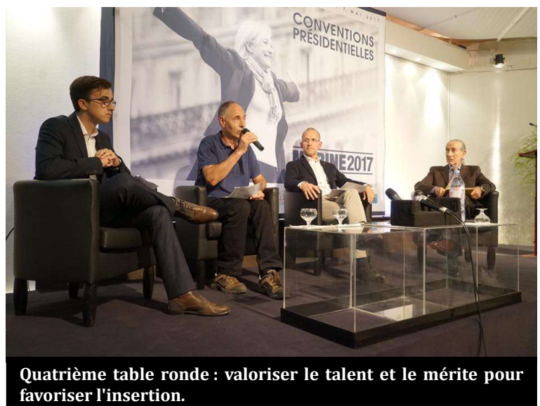
Quatrième table ronde : valoriser le talent et le mérite pour favoriser l'insertion.

PROPOSITION 76 : Réduire au cours du quinquennat la part des professeurs agrégés enseignant en collège, en les redéployant vers les lycées, les universités (statut de PRAG), et les CPGE, sous condition de validation par l'Inspection générale de la discipline. ●●●