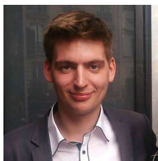
Table ronde N°3