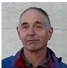
Table ronde N°4

par Marc Chapuis Professeur en CPGE scientifiques