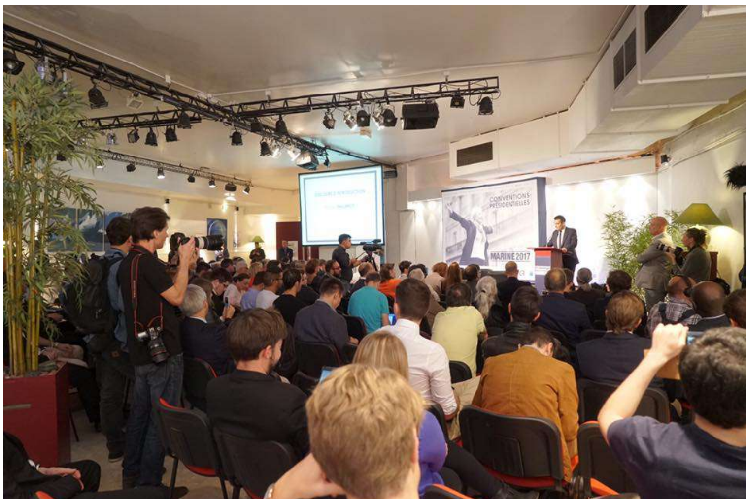
Discours de Florian Philippot, lors de la Convention présidentielle de Marine Le Pen sur l'Education nationale et l'Enseignement supérieur, jeudi 22 septembre.

École apaisée, qui permettra de retrouver notre rang dans le concert des nations, car comme le disait Jules Simon, philosophe et homme politique de la III ème République, « le peuple qui a les meilleures écoles est le premier peuple, s'il ne l'est pas aujourd'hui, il le sera demain ». ●