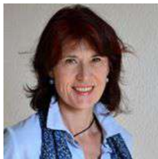
Table ronde N°1

par Valérie Laupies Vice-présidente du Collectif Racine Professeur et directrice d'école Conseillère régionale PACA