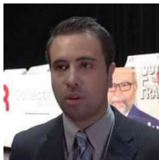
Table ronde N°2