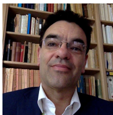
Table ronde N°1