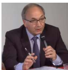
Table ronde N°3